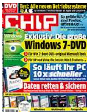
Die neue CHIP: Jetzt am Kiosk.

Für Experten und Anwender, die es genau wissen wollen, bietet Microsoft das Tool OffVis in einer Beta-Version an. OffVis öffnet Office-Dokumente, zeigt sie in Hex-Code an und bildet ihre innere Struktur mit den eingebundenen Elementen ab. Zusätzlich identifiziert OffVis sogar Schädlinge, die bekannte Sicherheitslücken ausnutzen.