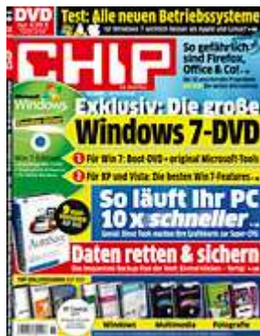
Die neue CHIP: Jetzt am Kiosk.

Jede infizierte Website kann Lücken in einem ActiveX-Plug-in nutzen. Dazu braucht sie nur dessen ID-Kennung und schon startet das unsichere Plug-in im Browser. Wer auf die Dienste von ActiveX verzichten kann, sollte es im Internet Explorer ausschalten. Sie finden die entsprechenden Einstellungen unter »Extras | Internetoptionen | Sicherheit | Stufe anpassen«.