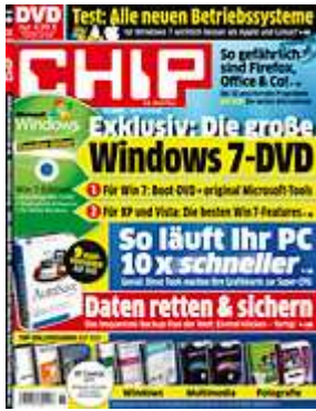
Die neue CHIP: Jetzt am Kiosk.

JavaScript aktivieren«. Eine entsprechende Vorgehensweise für ActionScript ist nicht möglich, denn die Flash-Funktionalität im Adobe Reader lässt sich nicht deaktivieren.