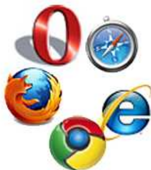
Sicherheitslücken: Jeder Browser hat seine Schwächen.

Die Anzahl der Firefox-Lücken steigt seit zwei Jahren stetig an, die des IE sinkt leicht. Trotzdem lässt sich mittels statistischer Daten nicht