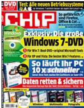
Die neue CHIP: Jetzt am Kiosk.

Sicherheitslücken, die einen Buffer Overflow ausnutzen, werden deshalb immer als kritisch eingestuft. Kein Wunder, dass QuickTime mit 9,2 von 10 einen sehr hohen Durchschnittswert bei der Schwere der Sicherheitslecks hat.